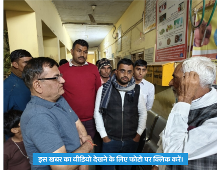
इस खबर का वीडियो देखने के लिए फोटो पर क्लिक करें।

श्रीद्वंगरगढ़ नेशनल हाइवे पर दो गाड़ियों की भिड़ंत हुई जिसमें एक व्यक्ति की मौत करंट से हो गई। प्राप्त जानकारी के अनुसार गांव सातलेरा के जीएसएस के पास एक जीप और एक बोलरो की भिड़ंत हुई। इसमें बिगना निवासी एक युवक जीप से उतरकर दौड़ा, परन्तु वहां हाई वोल्टेज करंट की चपेट में युवक आ गया और इसके कारण उसकी मौत हो गई। मौके पर पुलिस और आपणों गांव सेवा समिति के सेवादार पहुंचे और मृतक के